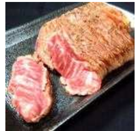
『人気のレアステーキ』

佐賀県で現在家畜農家をしている元料理人の友人が自ら飼育した食肉を卸す為、関西に営業に来ていた時、偶然会う機会があったそうです。独自の飼育方法や管理方法、そして彼自身がイタリアやフランスで培った秘伝の熟成方法等を熱く語る姿から、可能性を感じ感化されたことが、第一の理由でした。そして、ちょうどそのタイミングで、飲食店を真剣に生業としてやっていきたいという熱い人(今の店長さん)と運命的に出会ったことが、今回の出店の決め手となりました。