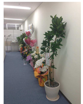
『お花をたくさん頂きました』

こんなに素敵な事務所に来られたのも、いつも支えて下さる皆様のお陰です。新しい事務所でも、スタッフ一同より一層頑張ってい参りますので、今後ともご支援の程よろしくお願い致します。