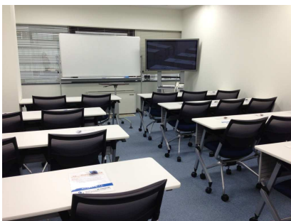
『セミナールームです』

事務所の入り口を入ると、長い廊下が続きます。ここには、引越し日に皆様から頂いた色とりどりのお花や植物は、こちらに飾らせて頂きました。