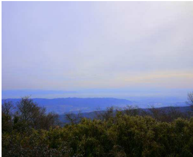
『生駒山からの景色』

お正月には、 しぎさん 信貴山まで歩いて初日の出を見に行きました。信貴山は、家からも歩いて行ける所なので、よく散歩がてらお参りに行ったり、秋には紅葉を見に行ったりしています。今年は早起きをして、初日の出を見ることができました。すごく感動しました。