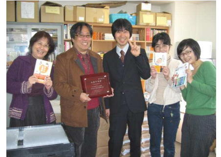
内山社長(左から二番目)と西日本出版社の皆さん

そして、東京の意見が日本の意見のようになっている中、西日本という地域に足場を置く人間の思いを全国に伝えたいと「本籍地のある本」というコンセプトのもと、「市民の目線で物事を見る」、「西日本という地域から世界を見る」という事を、事業を行う上で大切にされています。