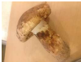
頂いた松茸を・・・