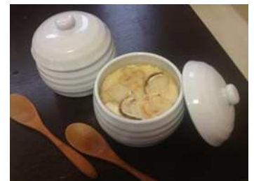
茶わん蒸しにしましたっ!!