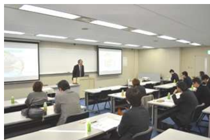
『経営革新セミナーの様子』

「財務経営力」とは、端的にいえば、 自らが会社の数値を理解し、具体的なプランを持ち、実現できる行動力を持つこと であるといえます。