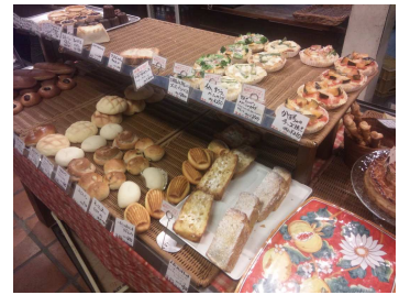
『肥後橋にある ブーランジュリー高木』