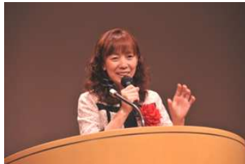
【映画「1/4の奇跡」の監督入江富美子氏の講演の様子】

人から用事を頼まれた時、「なんで俺がこんな事やらなあんねん」と思いながらイヤイヤやる人がいる一方で、「あなたは今、私を試していますね(にんまり)」と思いながらやる人がいます。後者の人は、どんな用事でも楽しいだろうし、それを続けていけば必ず幸せに生きていくことができると確信しました。「頼まれごとは試されごと」「頼まれごとは試されごと」、心に刻みつけたいと思います。