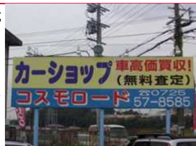
『この看板が目印です』