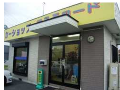
『事務所の入り口です』