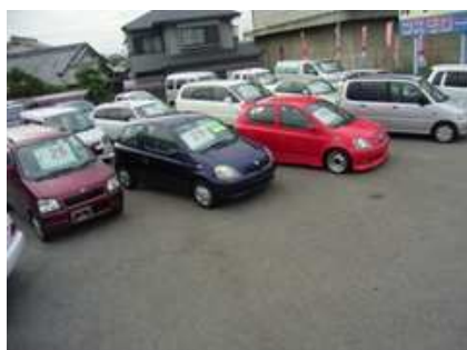
『売場にはたくさんの車が置かれています』