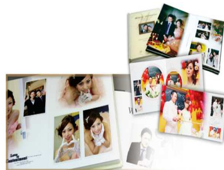
ウェディングアルバム

そのため、無料でカメラマンを派遣し、撮った写真を参加者専用WEBページに掲載し、気に入った写真を必要な枚数だけ購入できるサービスを展開しています。このサービスが好評で、今では提携しているレストランも着実に増えています。