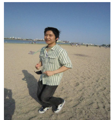
マラソンの練習中のワンショット