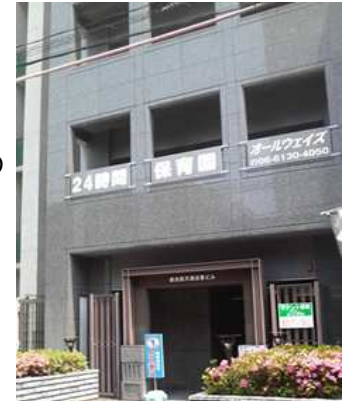
梅田園の外観です

認可保育園では対応できない日曜保育、突然の一時預り保育、夜間保育等、忙しいお母さん、お父さんの強い味方となっています。また、外国人講師による英語レッスンや運動会、遠足、海水浴等のイベントはもちろんのこと、ウェブカメラでお子様の様子をご覧いただけるライブサービスなども行っています。他にも毎日更新されているブログ、フェイスブックでお子様の様子をお知らせする等、利用者が安心して利用できるためのユニークなサービスを積極的に取り入れ、ご父兄の方々からも大変高い評価を得ています。