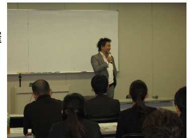
平山社長ありがとうございました。

今後も引き続き、「セミナー開催」「お客様との懇親会」、続けていきたいと思っておりますので、次の機会にも是非、ご参加いただければと思います。