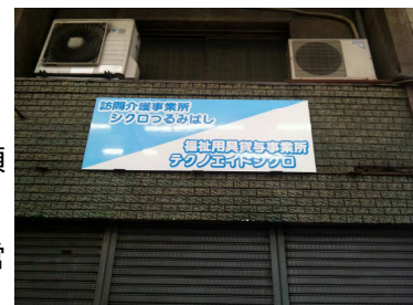
事務所前の看板です

合同会社シクロ様は、大阪市西成区にて介護事業であるヘルパーステーションの運営を意欲的にされておられる法人様です。