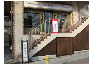
灘駅前店がJR灘駅前にオープン。