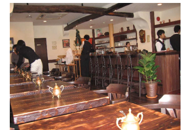
店内はアンティークな雰囲気。