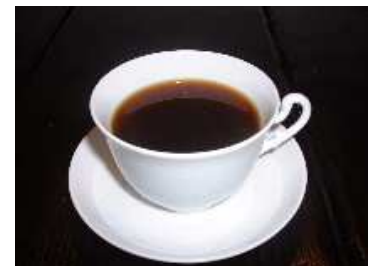
バランスのとれた味わいの珈琲。