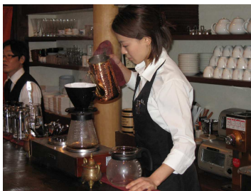
一杯一杯心をこめて淹れてます。

春秋オリジナルのブレンドによる珈琲豆は店内やインターネットで購入することもできるので、ご自宅でも春秋の珈琲を楽しむことができます。もちろん贈答用にも喜ばれる逸品です。