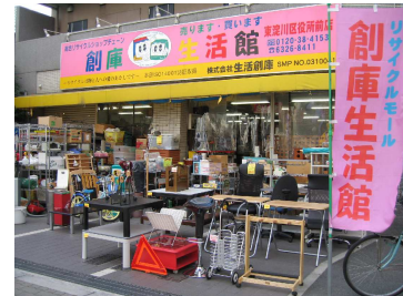
ピンクの看板が目印のお店です。

「陽気に、気楽に、景気よく!」をモットーに、地域に根差したリサイクル店としてお子様からご家族連れ、お年寄りまで沢山のお客様が訪れます。