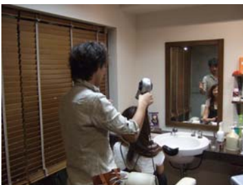
安心してお任せできます。

また、カラーやパーマ、トリートメントではお客様の髪質によって薬剤を使い分けて、お客様の理想の髪質やスタイルを実現しています。特に従来のトリートメントでは、数回のシャンプーで効果が薄れてしまうところを、Bounty hairsで採用している高分子ケラチンPPTにより疎水反応させるトリートメントでは本来の髪の毛の持つ水分・油分・タンパク質のバランスを整えることで健康な髪に近づけることができます。トリートメントを体験したお客さまからも「自分でセットがしやすくなった」「髪の毛が絡まりにくくなった」と、とても好評です。