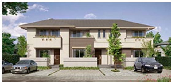
積水ハウス ヴィラーチェ

ベルーフでは関与先の皆様への不動産面でのサポート充実を図るため、総合住宅メーカーである積水ハウスと提携し、各種サービスを提供しております。