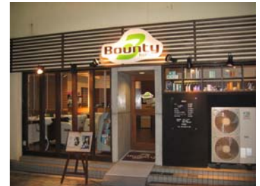
ナチュラルな雰囲気のお店です。

Bounty (バウンティ)とは・・・気前の良さ、恵み深さ、博愛、寛大、恵み物、賜り物という意味があります。